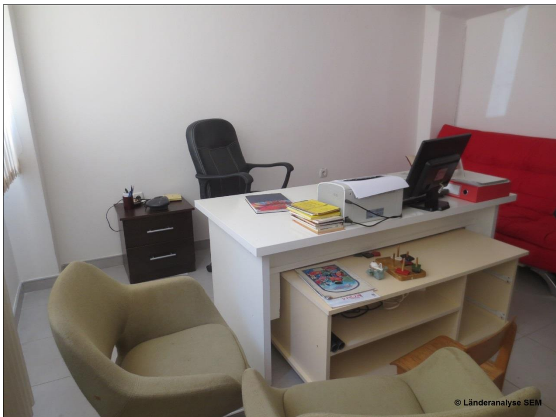
Büro eines Logopäden an der Universitätsklinik in Pristina 20