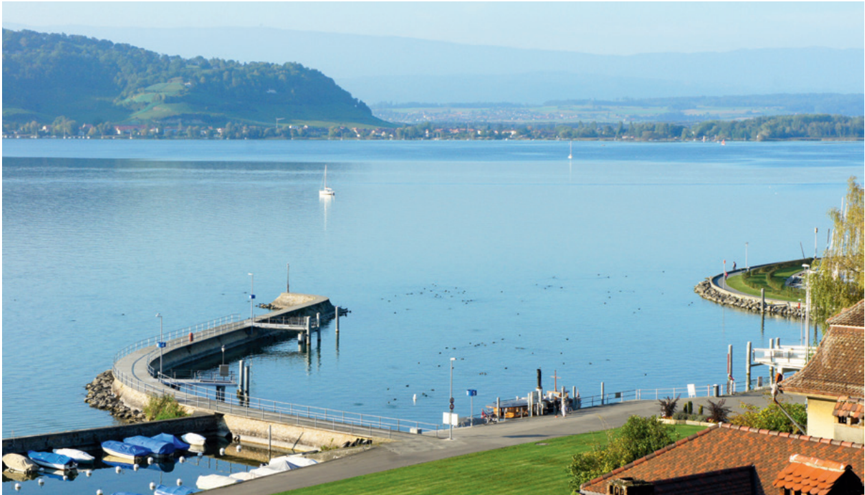
5 Mesurer le champ dans un LUS, c'est un peu comme de déterminer, par sondage, l'amplitude des vagues dans un port (ici Morat) et de ne retenir que l'amplitude maximale.