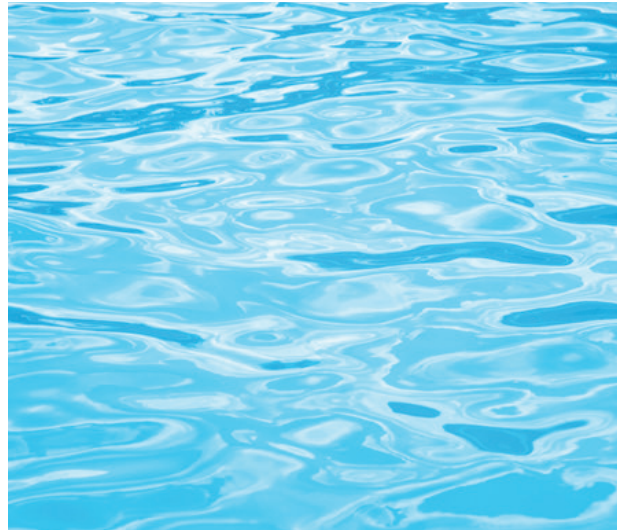
3 Deux phénomènes différents: à gauche les vagues provoquées par une goutte d'eau, à droite une surface d'eau agitée par le vent, où les ondes provenant de différentes directions interfèrent.