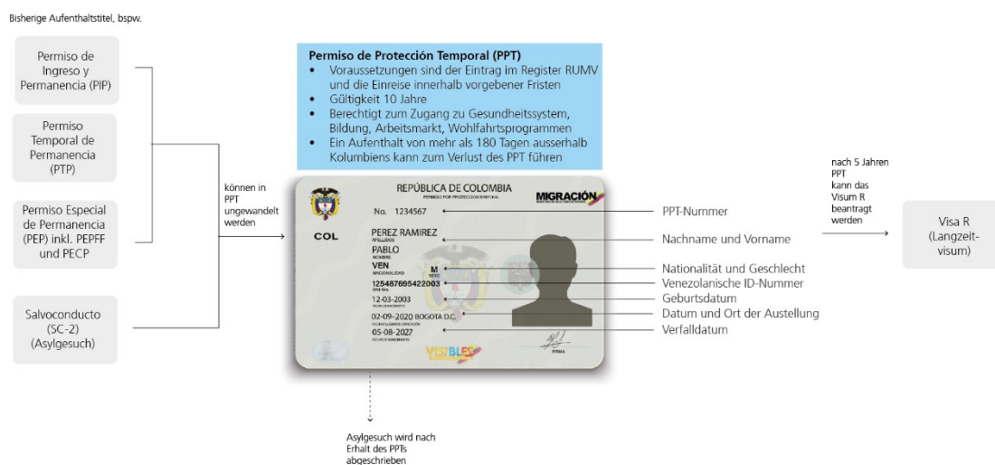
Abbildung 1: Wege der Legalisierung des Aufenthalts für venezolanische Migrantinnen und Migranten in Kolumbien

Der Permiso de Protección Temporal (PPT)