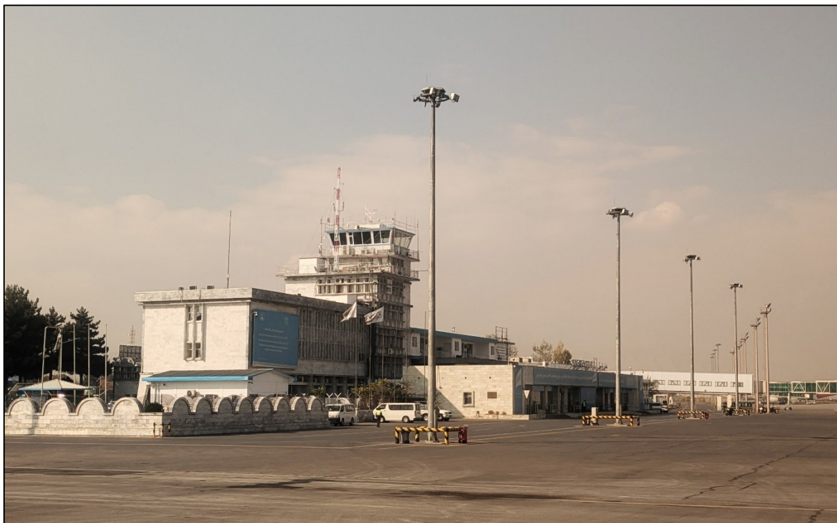
Der internationale Flughafen von Kabul (Foto: Länderanalyse SEM, November 2024).

Frühling 2022 herrscht wieder Normalbetrieb. 90 Einer Quelle der norwegischen Länderanalyseeinheit Landinfo zufolge waren die Taliban im März 2022 im Flughafen Kabul «völlig unsichtbar». 91 Da die Taliban zu diesem Zeitpunkt noch wenig Erfahrung im Betrieb eines internationalen Flughafens hatten, setzten sie vorerst auf das Personal der bisherigen Regierung und auf private Firmen, in Zusammenarbeit mit der Türkei und Katar. 92 Seither hat sich die Situation laufend verändert. Landinfo schrieb in Bezug auf die Situation im März 2022, dass die Taliban im Flughafen selbst nicht sichtbar seien und dass private Firmen für die Sicherheit zuständig seien. 93 Im September 2022 beauftragten die Taliban das Unternehmen GAAC Solutions aus Dubai mit dem Betrieb und der Sicherheit des Flughafens. 94 2023 übernahmen die Taliban schliesslich selbst die Flughafensicherheit. 95